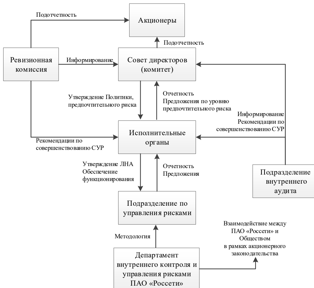
Рисунок 1 – Вертикальное взаимодействие в рамках СУР

7.2. Взаимодействие между участниками СУР на различных уровнях иерархии (вертикальное взаимодействие в рамках СУР) представлено на рисунке 1.